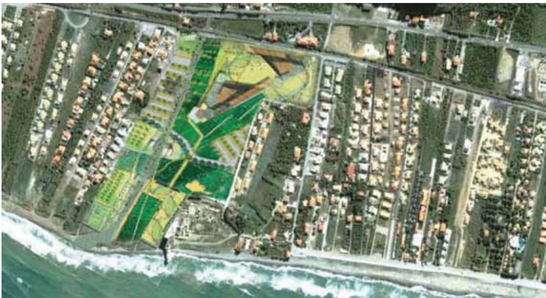
SIMULAZIONE DI PROGETTI FUTURI