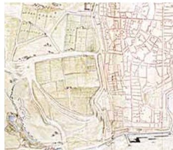
Francesco Negro, carta storica Palermo, 1640

Nel 1572 si avrà l'apertura di via dello Spasimo e la definizione della passeggiata a mare detta via Colonna. Extra moenia permane la totale assenza di urbanizzazione.