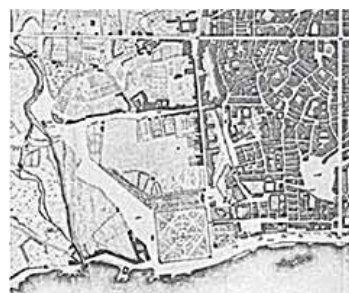
Gaetano Lossieux, carta storica Palermo, 1818