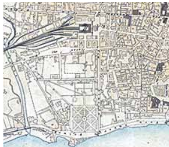
Cartografia OMIRA 1939

Nella cartografia di Villabianca (1777) si evince un ulteriore avanzamento urbano, ovvero: l'istituzione dello "stradone Alcalà" alberato a pioppi (1632-1637) odierna via Lincoln.