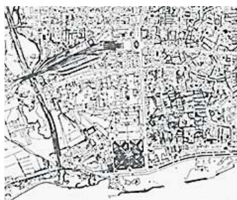
Cartografia IRTA 1956