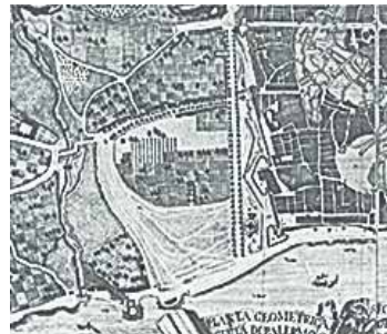
Villabianca, carta storica Palermo, 1777